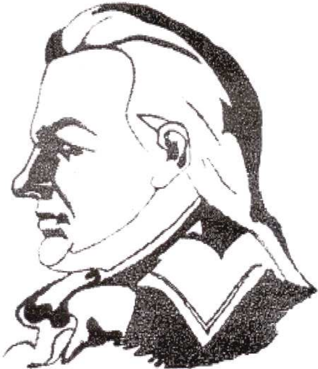
GENERALISIMO FRANCISCO DE MIRANDA 28.03.1750 - 14.07.1816